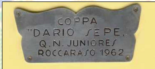
Figura 3 - Targa della Coppa

A Roccaraso fin dal 1962 lo Sci Club Napoli organizzava una importante gara di qualificazione nazionale di sci alpino: